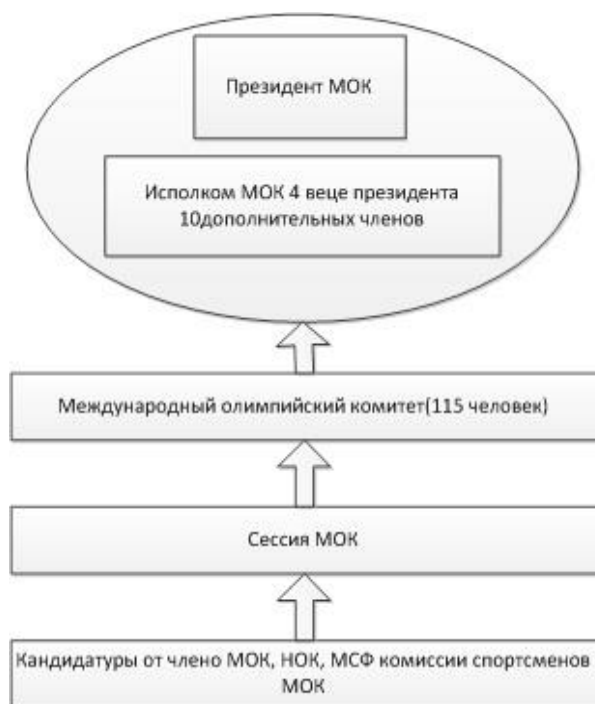
Рис 2 Организационная структура МОК

Предлагать кандидатуры для избрания в состав МОК имеют право: